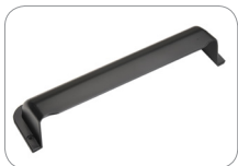
WC_IR/BL Schwarze Wetterabdeckung