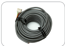
5 PIN CAB - 8 m Hotron 8 M Kabel