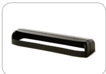
COV-HR400/BL Schwarze Sensorabdeckung